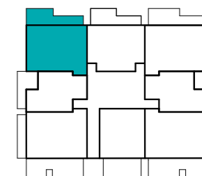
Položaj stanovanja v nadstropju - tloris