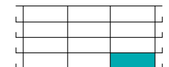
Položaj stanovanja v stavbi - prerez