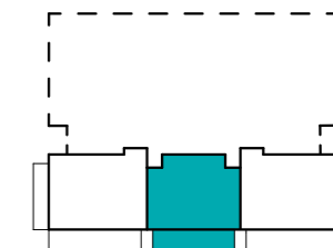
Položaj stanovanja v nadstropju - tloris